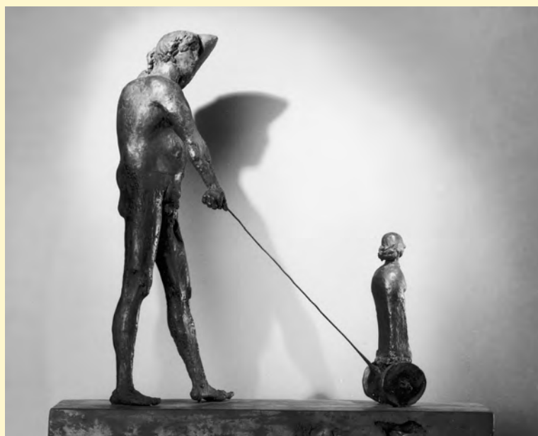
Giancarlo Defendi: scultura.