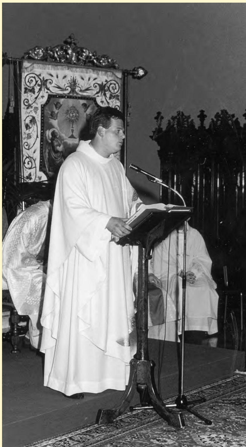
Saluto alla 1 a Messa ad Almè

... è soprattutto importante, per la fede dei viaggiatori, che qualcuno ci racconti di Dio: un Dio laborioso, instancabile, che non si dimentica di nessuno, che non dice mai di no, che cerca uomini generosi, sempre pronti a interpretare la sua sollecitudine per gli uomini, per tutti; per quelli, soprattutto, che fanno più fatica.