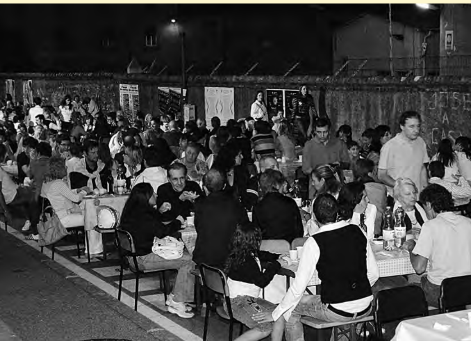
Feste di quartiere