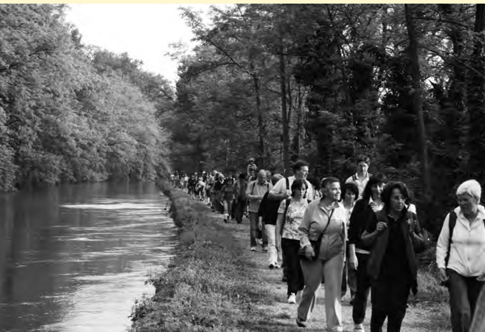
Camminata pellegrinaggio sull'Adda